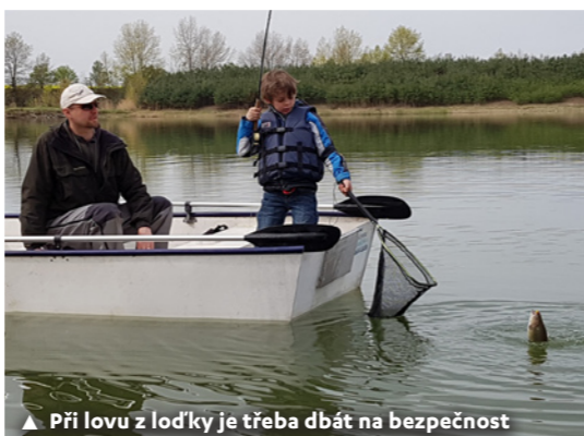
▲ Při lovu z loďky je třeba dbát na bezpečnost