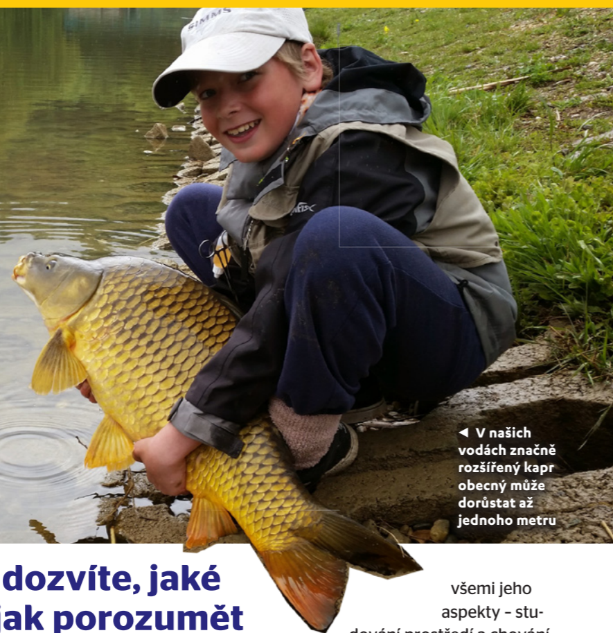
◀ V našich vodách značně rozšířený kapr obecný může dorůst až jednoho metru