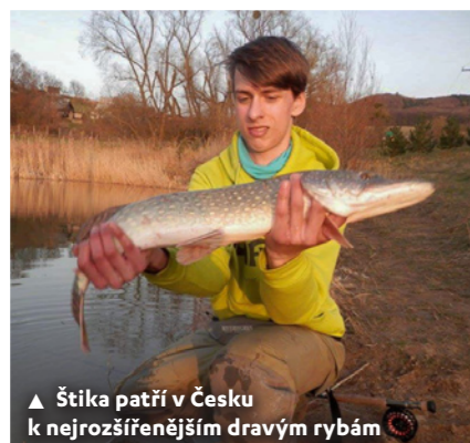
▲ Štika patří v Česku k nejrozšířenějším dravým rybám

navíc rybu pustit s minimálním poškozením zpět do vody a umožnit tak zážitek z lovu dalšímu rybáři. Tím můžete být i vy, pakliže se zachováte podle platných zákonů a nařízení. Rybolov je totiž regulovaným sportem (musíte tedy dodržovat jeho pravidla), aby nedocházelo k absolutnímu výlovu ryb a poškozování životního prostředí. Především potřebujete takzvaný rybářský lístek. Jak se k němu dostat?