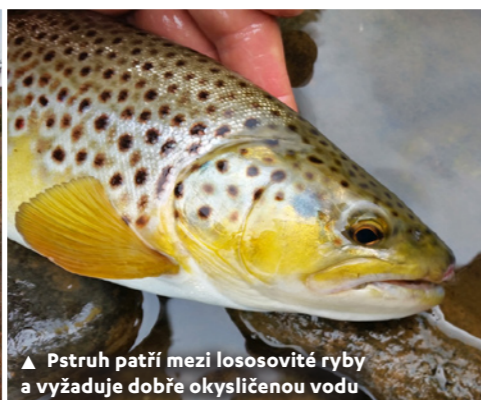
▲ Pstruh patří mezi lososovité ryby a vyžaduje dobře okysličenou vodu